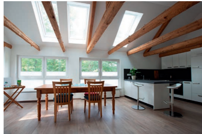
Großzügig, hell und doch bodenständig. Ein Blick in eine der neuen Ferienwohnungen auf dem Campingplatz am Furlbach.

Ferien im einzigartigen Naherholungsgebiet